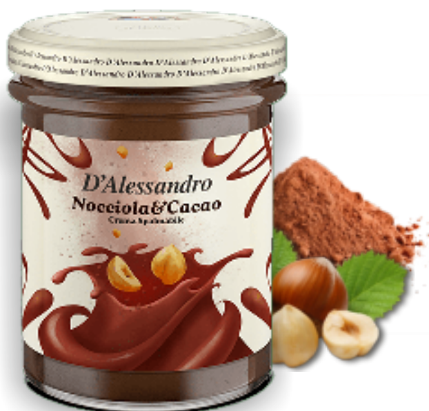
Crema Cacao & Nocciole gr. 220x6 A00740

Disponibili ai gusti: Pistacchio, Cioccolato Fondente, Nocciola&Cacao e Cioccolato Bianco metteranno d'accordo i palati di grandi e piccini. Ideali a colazione su una fetta di pane morbido o a merenda, perfette per la preparazione di crostate e frollini.