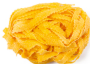
Zigrinate all'Uovo secca - gr. 250x12 AM0205