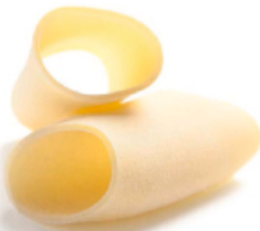
Paccheri Grano Puro secca - gr. 500x12 Am0230