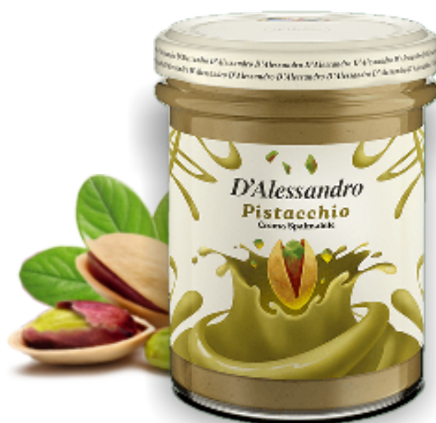
Crema Pistacchio 30% gr. 220x6 A00743