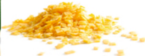
Quadretti all'Uovo secca - gr. 250x12 AM0220