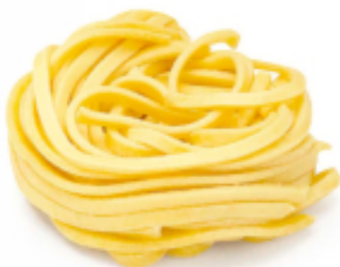
Tonnarelli all'Uovo secca - gr. 250x12 AM0203