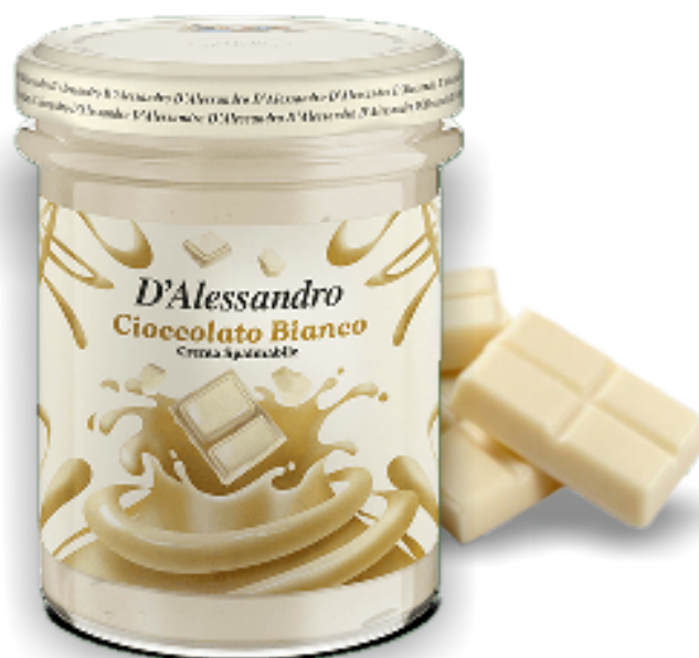
Crema al Cioccolato Bianco gr. 220x6 A00741