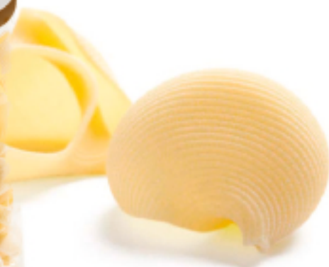
Lumaconi Grano Puro secca - gr. 500x12 Am0232