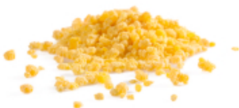
Grattoni all'Uovo secca - gr. 250x12 AM0221