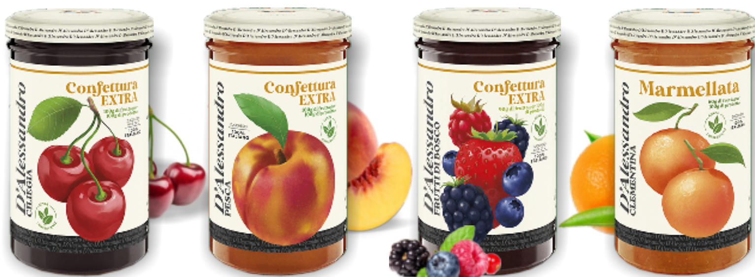
Confettura di Ciliegia gr. 310x6 A00724