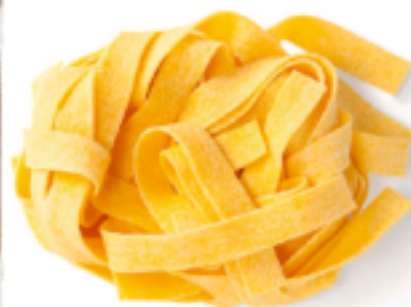
Pappardelle all'Uovo secca - gr. 250x12 AM0202