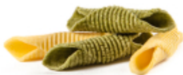
Garganelli Paglia Fieno all'Uovo secca - gr. 250x12 AM0212