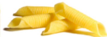
Garganelli all'Uovo secca - gr. 250x12 AM0211