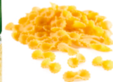
Farfalline all'Uovo secca - gr. 250x12 AM0222