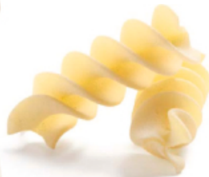
Fusilloni Grano Puro secca - gr. 500x12 Am0231