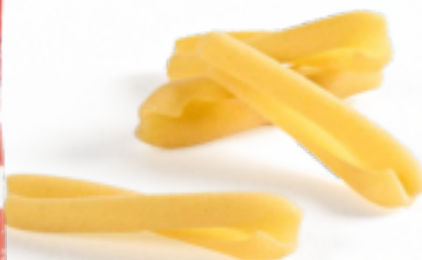
Caserecce Ercoli secca - gr. 500x20 Am0249