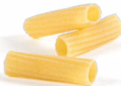
Tortiglioni Ercoli secca - gr. 500x20 Am0243