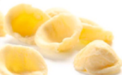
Orecchiette Grano Puro secca - gr. 500x12 Am0233