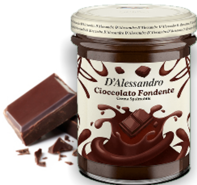
Crema al Cioccolato Fondente gr. 220x6 A00742