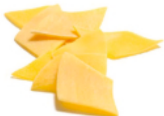
Maltagliati all'Uovo secca - gr. 250x12 AM0210