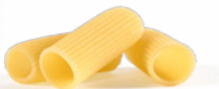
Rigatoni Ercoli secca - gr. 500x20 Am0244