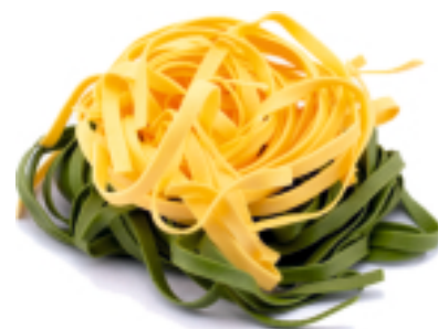
Paglia e Fieno all'Uovo secca - gr. 250x12 AM0204