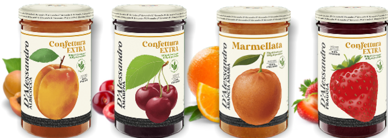
Confettura di Albicocca gr. 310x6 A00721

Tutte le confetture della linea Extra sono prive di glutine!