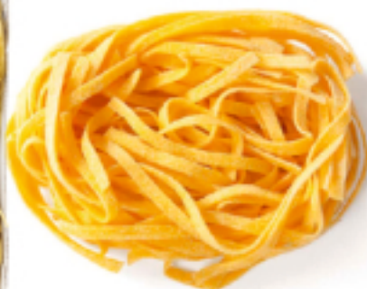
Tagliatelle all'Uovo secca - gr. 250x12 AM0201